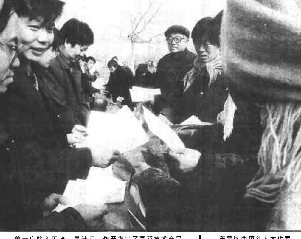
二月十九日，东营区牛庄镇邀请区农业局等有关部门，利用牛庄大棚向群众宣传农业科技知识，发放科技宣传材料三千余份，发送优质抗虫棉种二百多公斤，并接受群众农业科技知识的咨询，受到群众的欢迎。

曾一度陷入困境，累计亏损达150多万元的垦利县方大公司，在激烈的市场竞争中，巧打科技牌，依靠科技创新为企业撑起一片蓝天，闯出了一条腾飞之路。